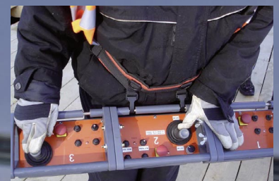
großes Bild: BKS hebt einen Wassertank, links: Kranknoten mit Messgeräten „gespickt“, rechts v.o.: Zeck-Winde Schalterpult mit Kraftmesser, eine Messflasche wird getestet, Steuerpult für die Winden